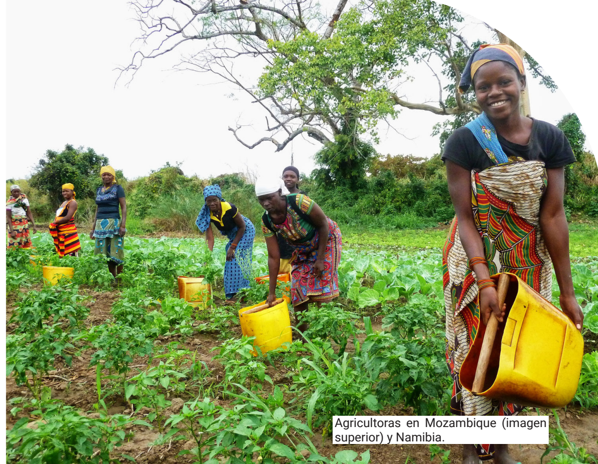
Agricultoras en Mozambique (imagen superior) y Namibia.

Así nació en 2014 el Programa 3C Cultivemos el Clima y la Comunidad . Implementado principalmente en zonas urbanas y periurbanas, responde a las necesidades de una ciudadanía con diversidad de identidades y expresiones sociales y culturales de los municipios participantes, a través de la agroecología como herramienta de seguridad alimentaria y de desarrollo local y social.