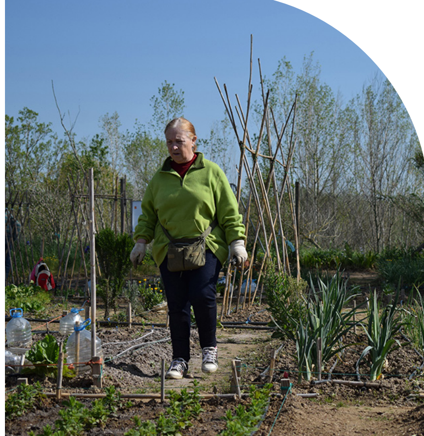
A la izquierda, activista en Tordera. En la parte inferior, usuarios en el huerto de Leganés (izquierda) y una imagen del de Lliçà d'Amunt.