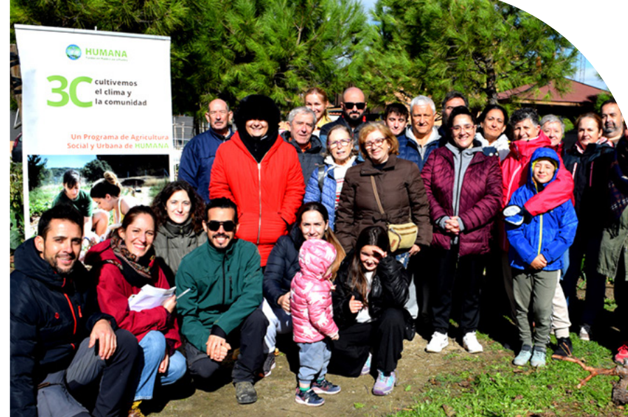
Jornada familiar en 3C Rivas-Vaciamadrid (arriba) y sesión de voluntariado corporativo con Repsol en 3C Leganés.