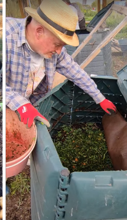
Activistas en el huerto de Daganzo (arriba izquierda), en Rivas-Vaciamadrid (arriba derecha) y, junto a estas líneas, en l'Ametlla del Vallès.