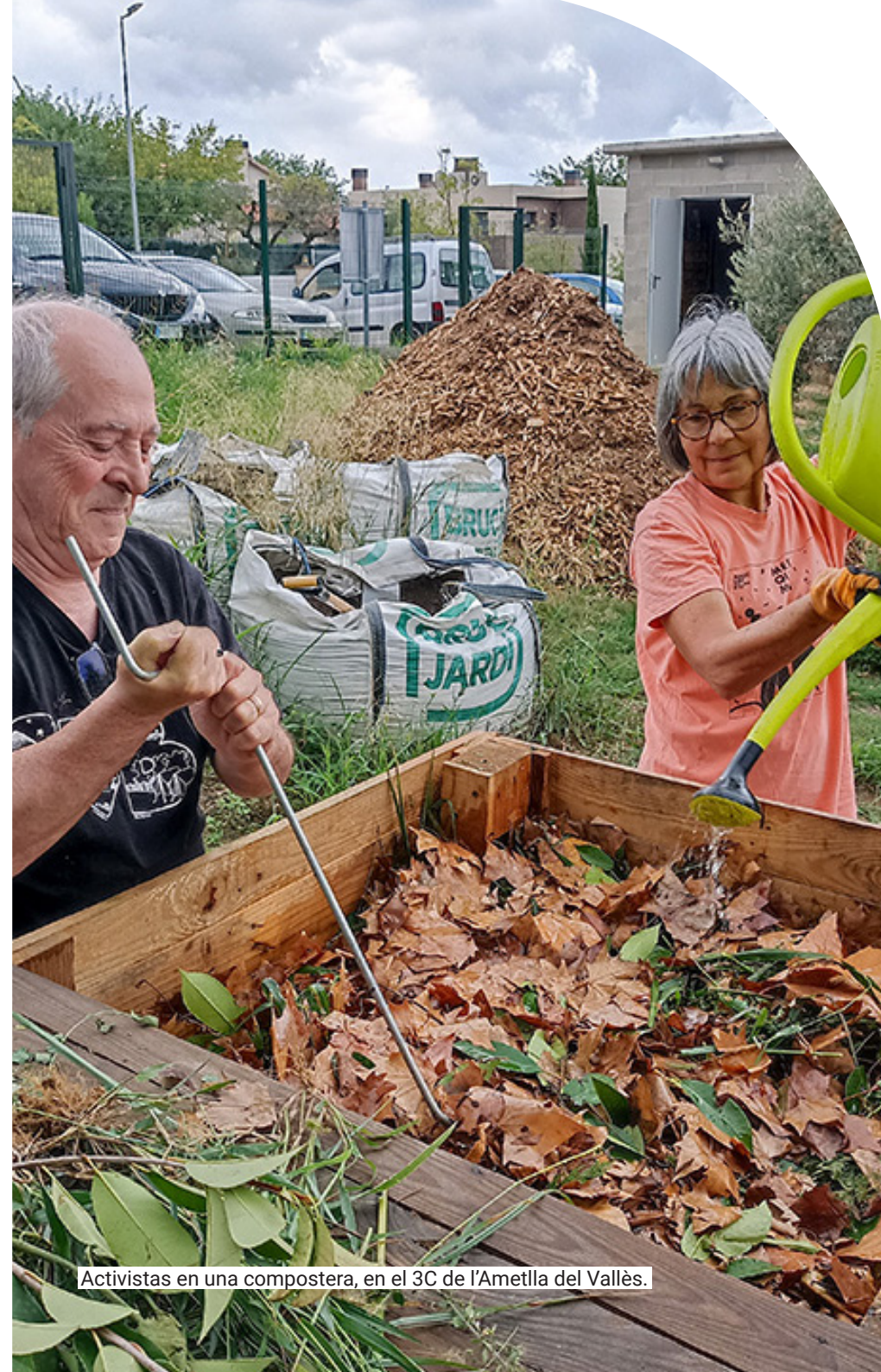
Activistas en una compostera, en el 3C de l'Ametlla del Vallès.

3.750 m 2 Octubre 2022 24 activistas + Asociación Arboleda