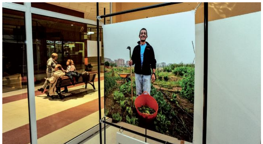
La exposición ha recorrido ya municipios como Oviedo, Gijón y Avilés

El centro comercial Los Prados de Oviedo, el centro comercial Opción de Gijón, el centro comercial el Atrio y el Hospital de San Agustín, ambos en Avilés, han acogido desde el mes de julio del pasado año la exposición “Humana y la agricultura social. Las personas y la tierra, lo primero” . La muestra, con imágenes del fotógrafo Patricio Michelín, ilustra el compromiso de la Fundación con la agricultura social a través de las experiencias de dos de los proyectos impulsados por Humana en Catalunya durante 2013: un huerto ecológico en VÍC (Barcelona) y una iniciativa de horticultura terapéutica en Lleida. ↓