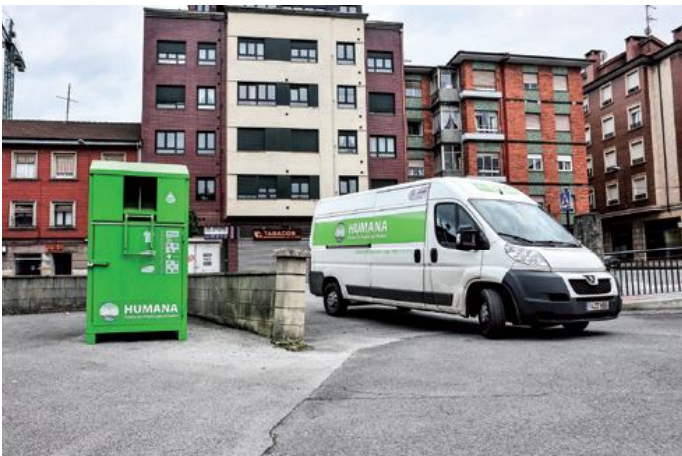
La organización cuenta con más de 250 contenedores en todo Asturias

se alargó durante más de un año. En este tiempo los técnicos del Servicio de Residuos de la consejería de Medio Ambiente del Principado revisaron las instalaciones con las que Humana cuenta en el polígono de Aspo (Llanera) así como la gestión que hace de la ropa y el calzado recogidos en los 274 contenedores con los que la Fundación cuenta en Asturias. El objetivo era verificar el cumplimiento de todos los requisitos legales exigidos tanto a nivel de transporte y traslado como de manipulación y almacenamiento.