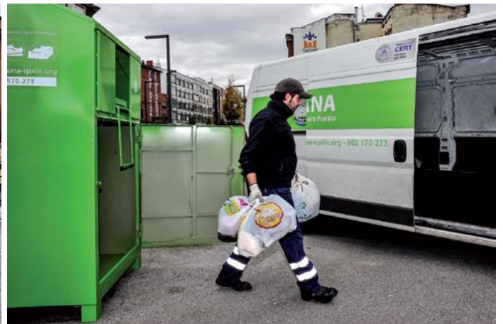
El servicio de recogida de textil usado se realiza los siete días de la semana en turnos de mañana y tarde