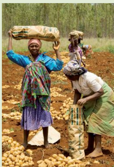
Más de 70.000 agricultores forman parte del proyecto en África y Asia

El 80% de la población africana está formada por pequeños agricultores. Los cambios climáticos y medioambientales, la presión a la que las grandes empresas de agro-business someten a las comunidades rurales y el alza del precio de los alimentos representan al mismo tiempo una amenaza y una oportunidad para los que viven de trabajar la tierra. Más de 500 millones de pequeños agricultores de África, América Latina y Asia producen alimentos para 2.000 millones de personas.