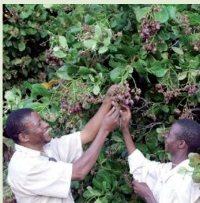
Las agrupaciones garantizan la seguridad alimentaria de la comunidad

La apuesta por este tipo de proyectos tiene también una vertiente de género y empoderamiento económico de las mujeres puesto que ellas representan la mayor parte de sus miembros. Su participación repercute, al mismo tiempo, en el bienestar de las familias, dado que el programa incluye actividades relacionadas con el saneamiento, el aprovechamiento de agua, la salud, la nutrición y la educación. Los agricultores están organizados en grupos de 50, liderados por un extensionista agrícola responsable de la formación teórica y práctica requerida para promover la auto-organización del colectivo y un mayor rendimiento de las cosechas.