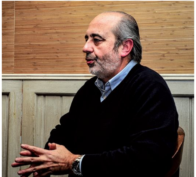
El Banco de Alimentos atiende a más de 25.000 personas en Asturias

JN. En los últimos 3-4 años está creciendo el número de familias que solicitan alimentos. Hasta entonces trabajábamos con un perfil muy concreto: personas con problemas de desarraigo que estaban vinculados a un albergue, a una cocina económica o a una institución similar. Ahora nos encontramos con la demanda directa de muchas familias que no están adscritas a ningún programa de ayuda y acuden directamente al banco. Esta situación nos obliga a buscar nuevas vías para poder llegar a ellas y atenderlas: Cruz Roja, Cáritas, asociaciones vecinales, sindicatos... Animamos a estas entidades y colectivos a crear un local para