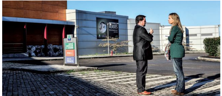
El centro de tratamiento de residuos de COGERSA se encuentra en La Zoreda - Serín

H. ¿Este cambio ha venido acompañado de una mayor conciencia ciudadana con respecto a la protección del medio ambiente?