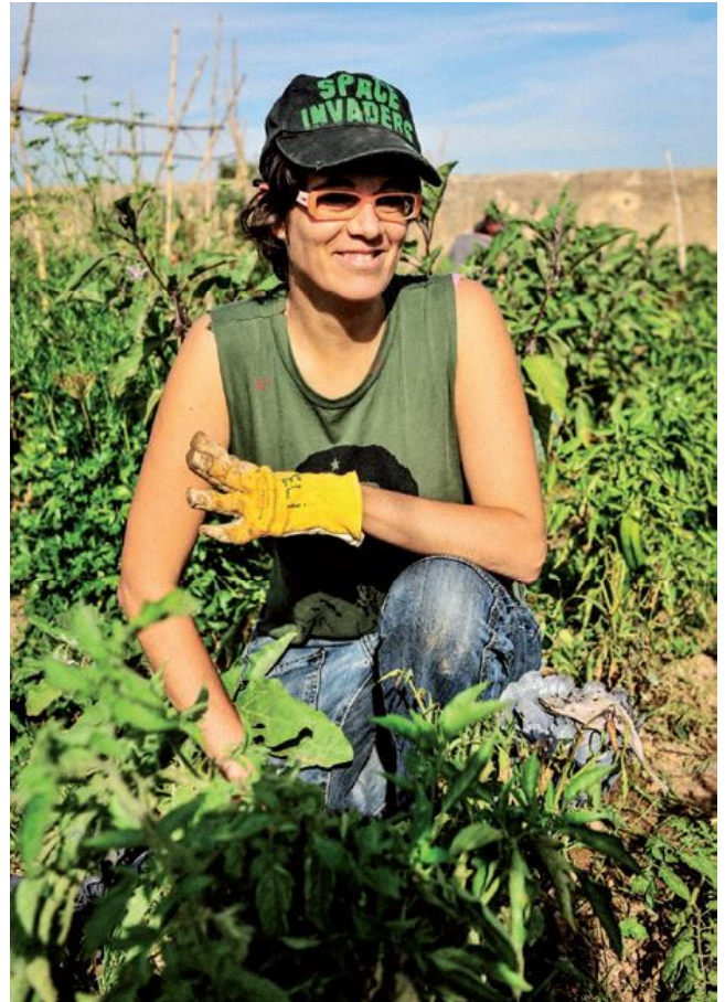
La agricultura social mejora la vida de las personas e impulsa proyectos sostenibles