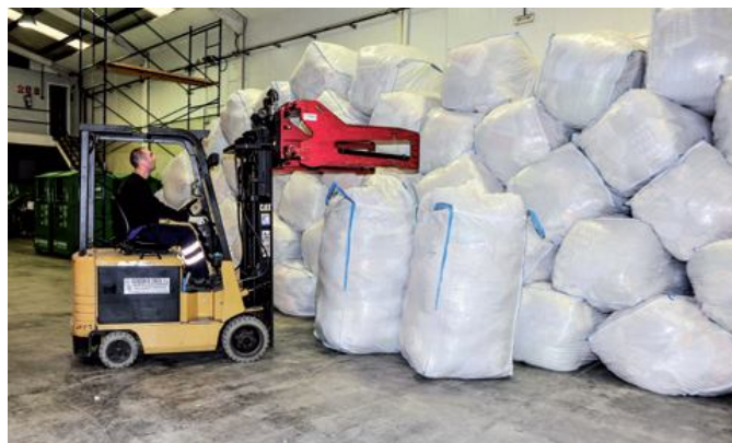
Su pequeña empresa cuenta ya con cuatro trabajadores en plantilla

por cuenta propia y lo acepté. En aquel momento tenía la motivación necesaria para hacerlo y decidí tirar adelante” , señala Carlos. “Empecé primero con un vehículo y luego añadimos otro de mayor tamaño a la flota y ahora ya somos cuatro